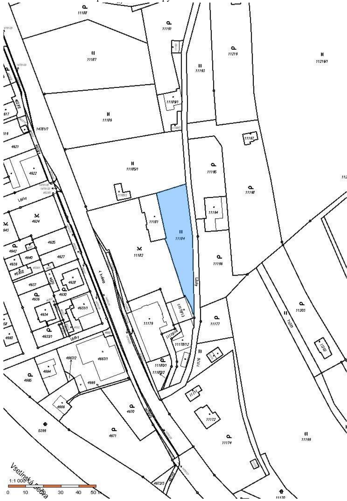
Pozemek p.č. 11184 v k.ú. 786764